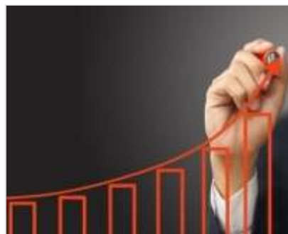
Comité Développement et